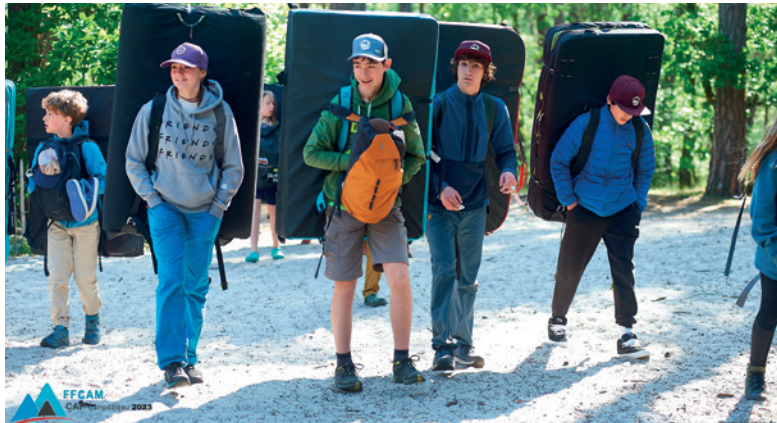
Camp4 Bleau

Les secours primaires, c'est-à-dire immédiats (du lieu de l'accident au cabinet médical ou l'hôpital le plus proche) sont effectués par les équipes de secours locales.